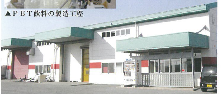
▲うるま市州崎の工場外観