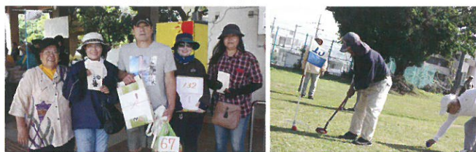
▲景品を貰って嬉しい参加者

今回の収益金はうるま市の人材育成のため、育英会へ寄付しております。また、寄付金、景品提供して下さいました多くの皆様に心より感謝申し上げます。