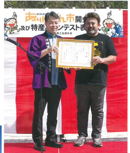
▲奨励賞を受賞したBONESさん

10月の沖縄。まだまだ暑い季節の中、各市町村の特産品を買い求めにこられるお客様で賑わいをみせていました。