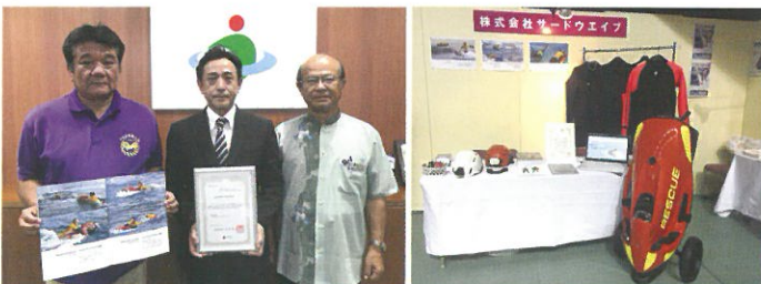
▲市長へ承認企業の表敬訪問

沖縄では、水難救助に特化したレスキューモデルの水中スクーターをレスキュー講習付で販売できる競合他社はなく、差別化と独自性に特徴があり、特にマリンアクティビティ事業者（ダイビングショップやリゾートホテル等）またレスキュー関係者との取引に期待をしています。 現在、海上自衛隊にミリタリー仕様の水中スクーターの納品実績はありますが民間仕様のレスキューモデルについては今後販路拡大について製品のさらなるPRが課題となっています。今後の抱負としては本事業を通じて新たな収益の柱を構築するとともに微力ながらも沖縄の海の安全に寄与できれば幸いです。