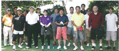
▲集った資金の贈呈式後関係者にて記念写真