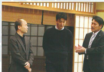
なばなの里イルミネーションの説明